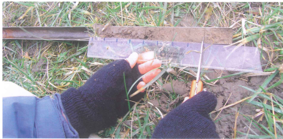
Metten van de doorworteling: met de hand en – tot nu toe – altijd in de winter.

Gedurende een jaar hebben onderzoekers de doorworteling van negentien zee- en rivierdijken geanalyseerd. Ze hebben daarin een seizoenspatroon geïdentificeerd. Volgens hen is de beste periode voor toetsing van de doorworteling, nu medio december tot medio maart, van 1 oktober tot 1 maart.